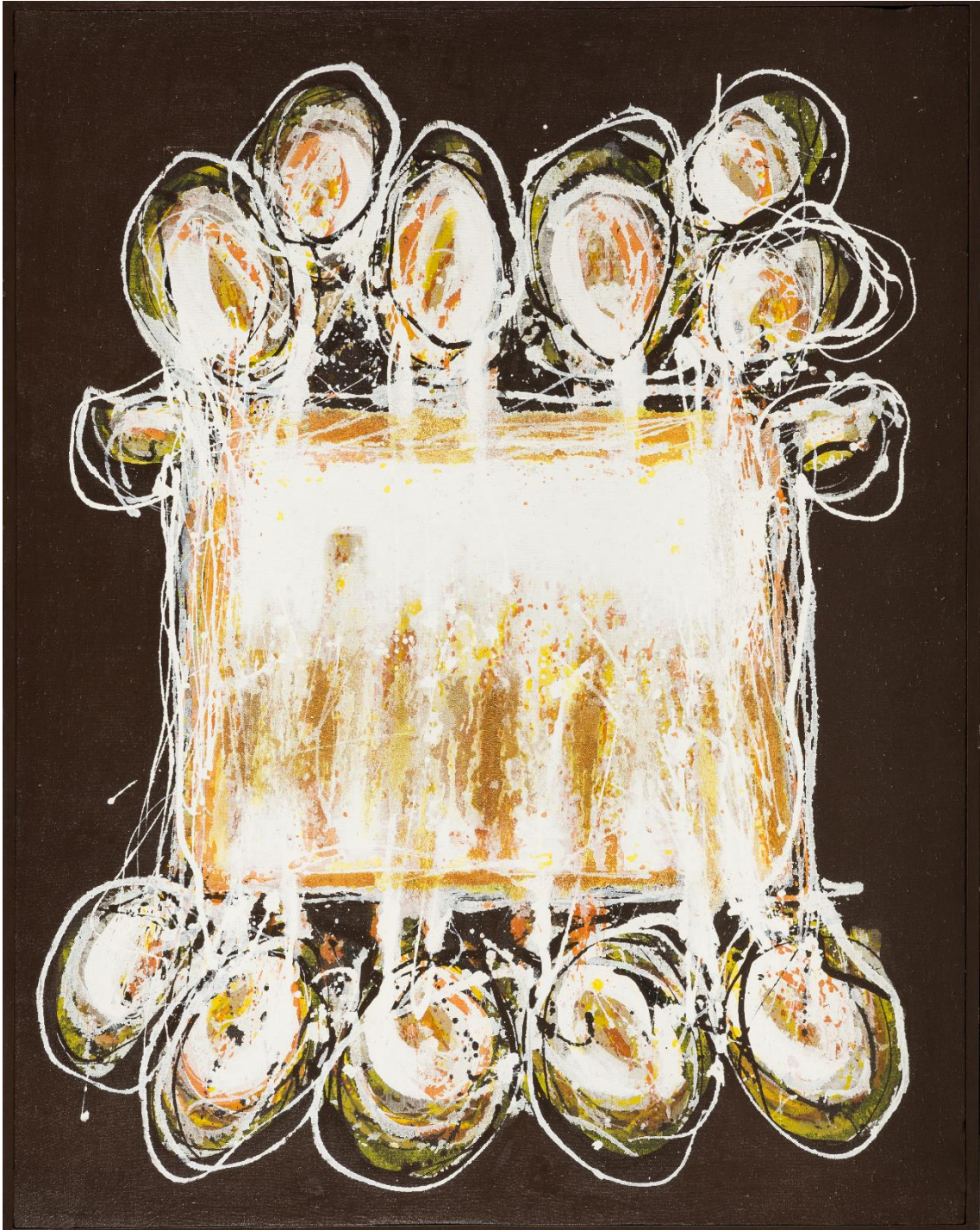
Sin título (Serie Cometas), 1989 Acrílico y arenas sobre tela, 132 x 165 cm